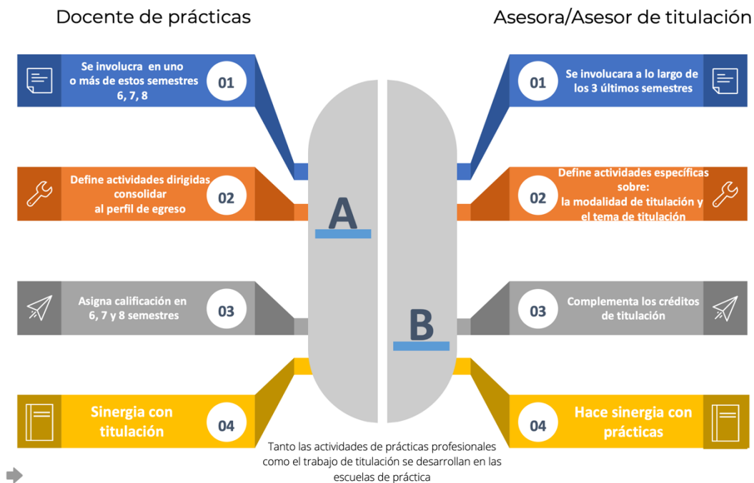
Fig. 4. Énfasis de docentes y asesores de titulación

El proceso de titulación se describe, de manera ampliada, en los documentos que están disponibles en la Página Web de la DGEsUM: